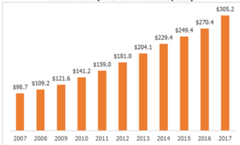
Gráfica 11- Activos Gestionados por las Aseguradoras de Pensiones en 2007-2017 (miles de millones de pesos)